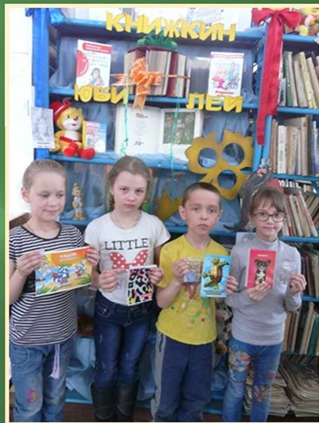
Лучшие читатели «Недели детской книги» Натальинская поселковая библиотека