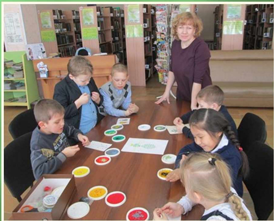
Кружок «Самоделкин» Красноуфимская Центральная районная библиотека