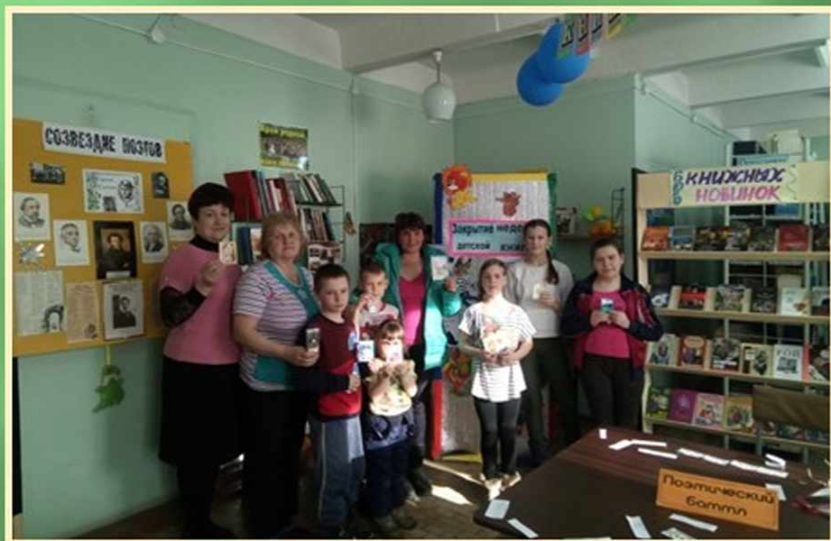
Поэтический баттл «Весна. Поэзия. Мечты» Александровская сельская библиотека