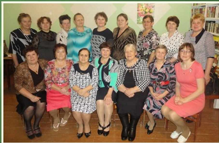
Женский клуб «Берегиня» Саранинская поселковая библиотека