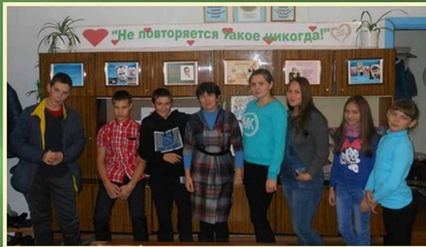
Клуб «Молодёжная пятница» Русскоустьмашская сельская библиотека