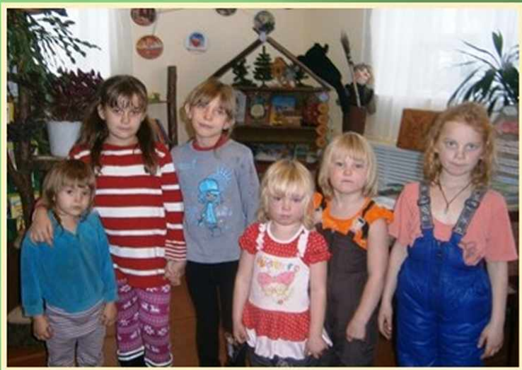
Детский клуб «Игротека в библиотеке» Чатлыковская сельская библиотека