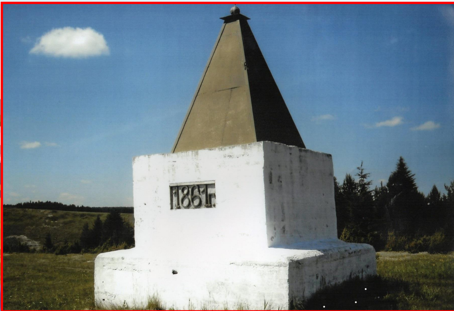
Памятник отмены крепостного права (с. Нижнеиргинское)