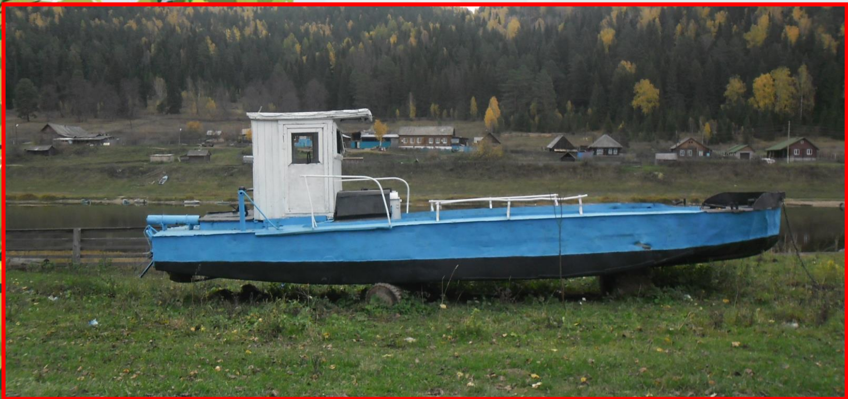
Катер, используемый для съёмок фильма «Тени исчезают в полдень» (п. Саргая)