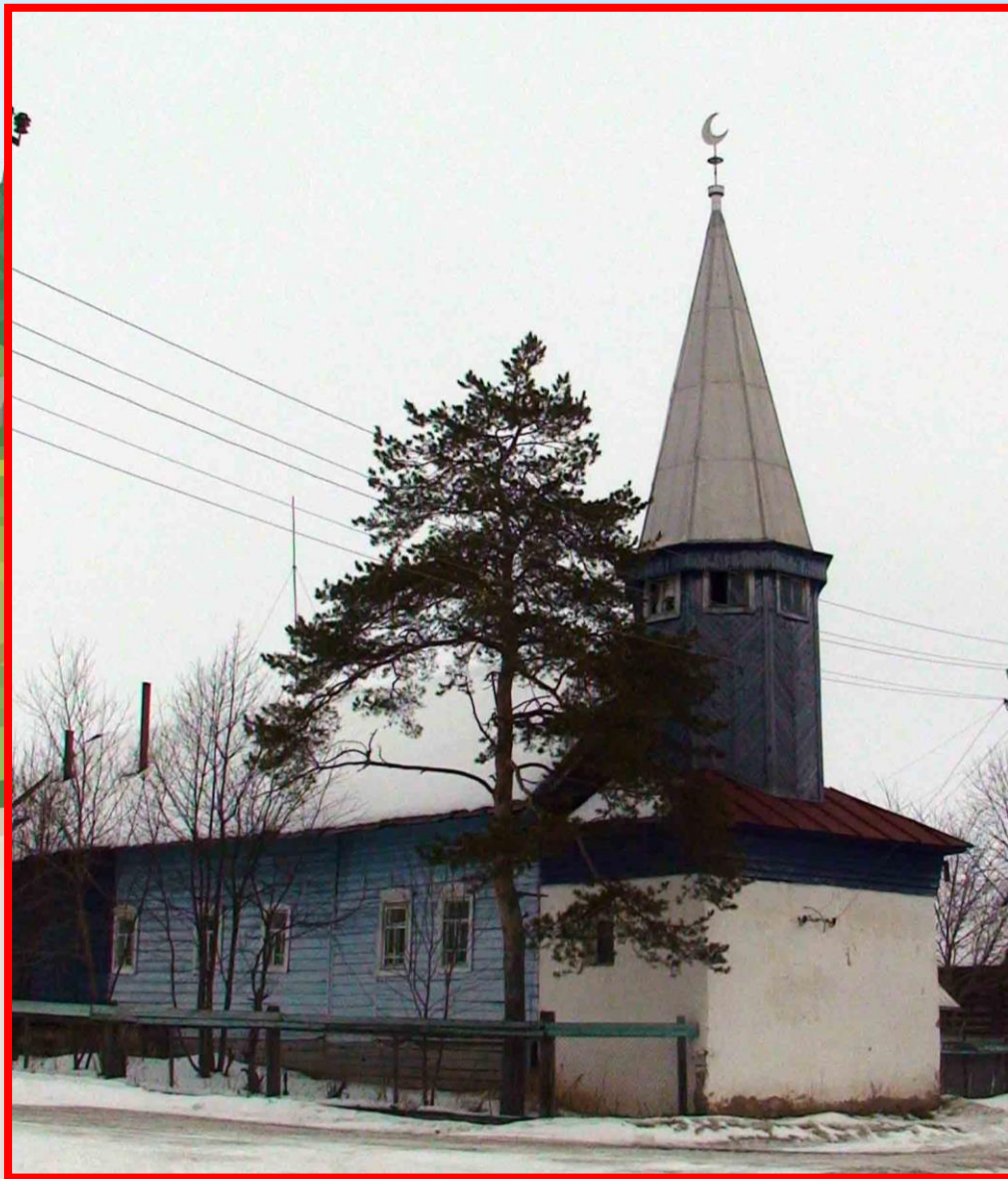
Мечеть (д. Новый Бугалыш)