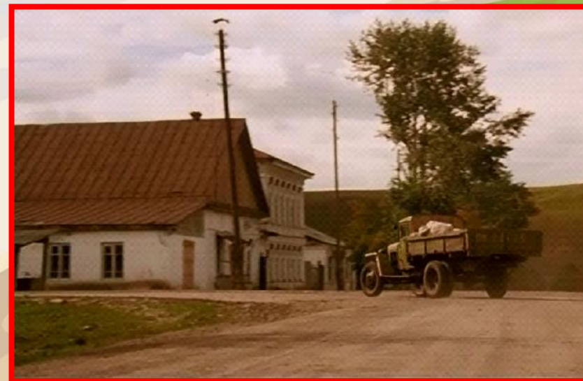
Центр с. Нижнеургинское