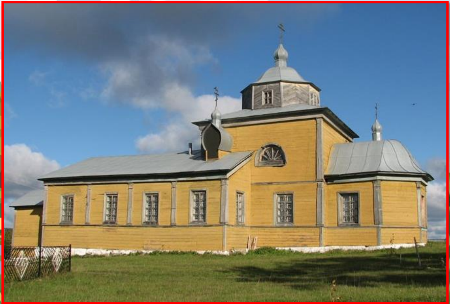
Крестовоздвиженская церковь (с. Новое Село)