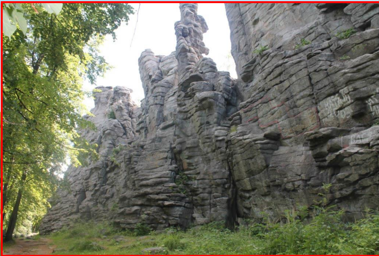
«Семь братьев» (д. Зауфа)