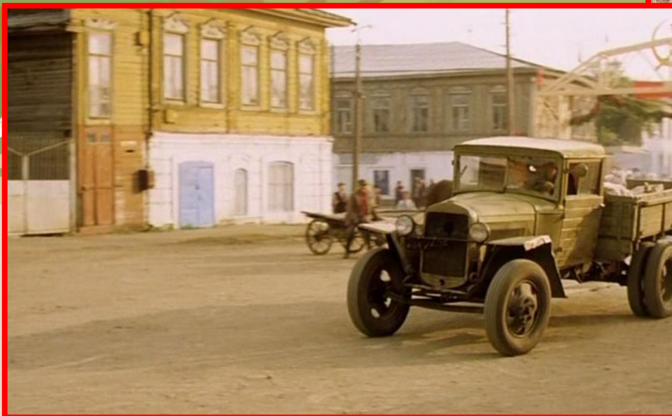
Бывшее здание Красноуфимской Центральной районной библиотеки