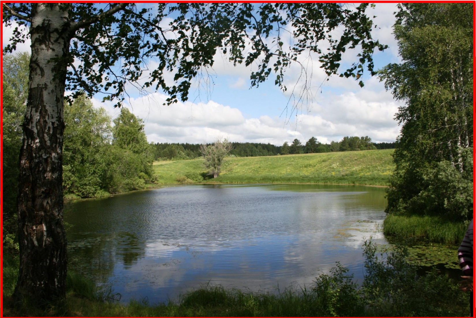
Озеро-провал «Черное» (д. Лебяжье)