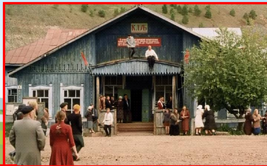
Здание Красносокольского клуба