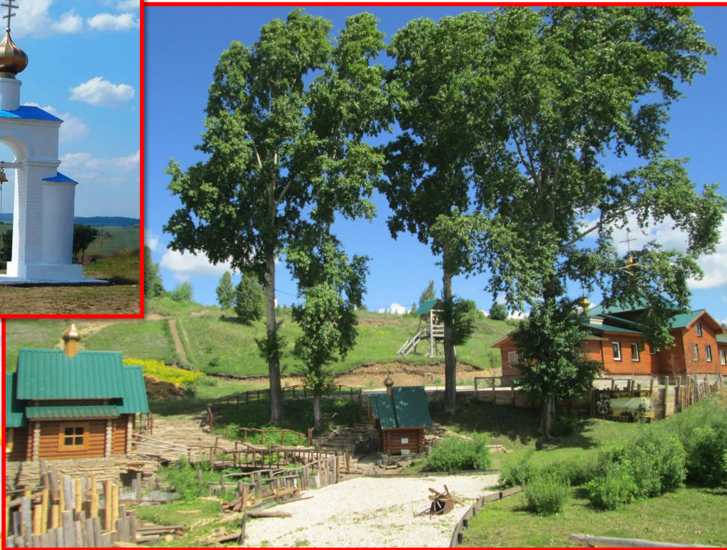
Обитель Сарсинского Боголюбского женского монастыря, (с. Сарсы Вторые)